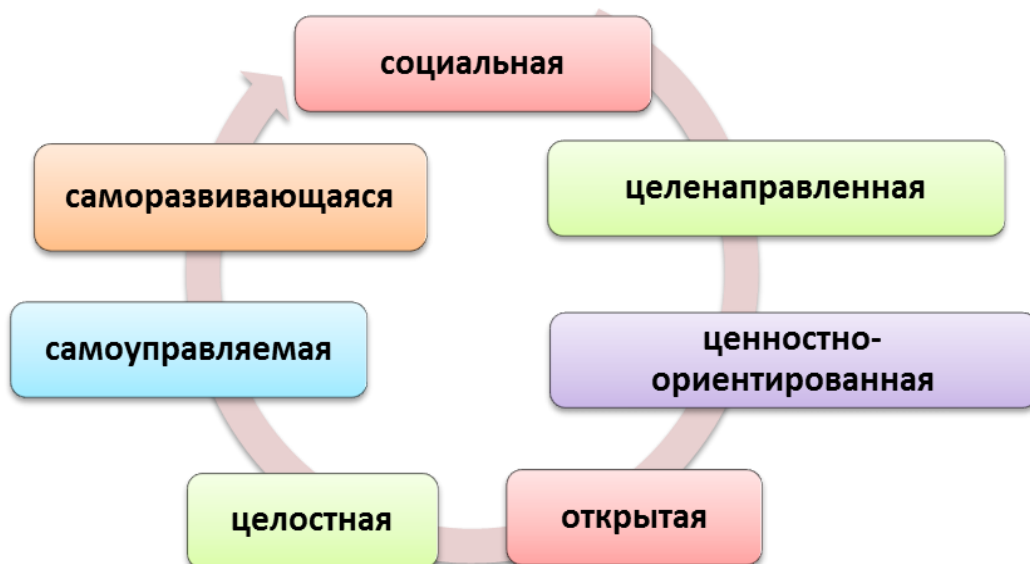
Таблица 1. Отличительные черты воспитательной системы Краснодарского ПКУ.